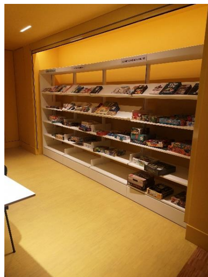
Espace jeux vidéo / Collection jeux de société & collection musique