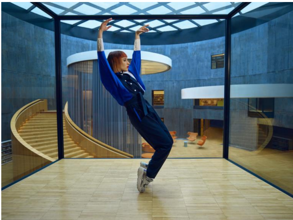
La chanteuse Suzane a réalisé un shooting photo à la bibliothèque.