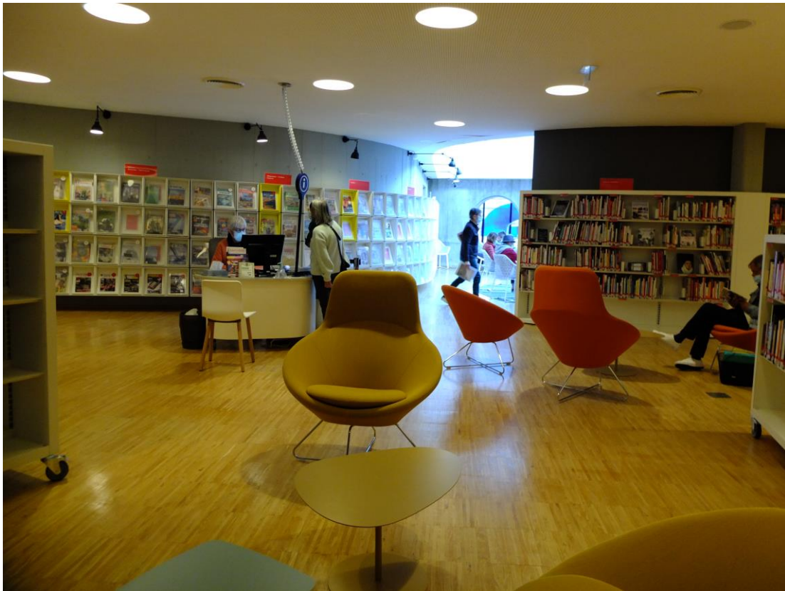
Des assises diverses. Un point d'information. Au fond, l'espace Presse.