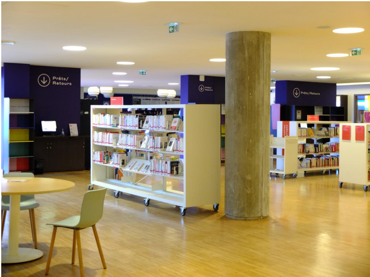
Postes RFID en libre-service et étagères sur roulettes.

L'autonomie de l'utilisateur est privilégiée par des postes de prêt/retour RFID en libre-service.