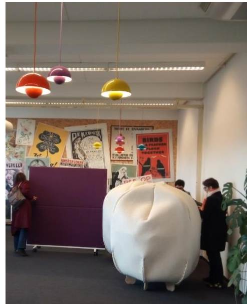
Cocons de repos