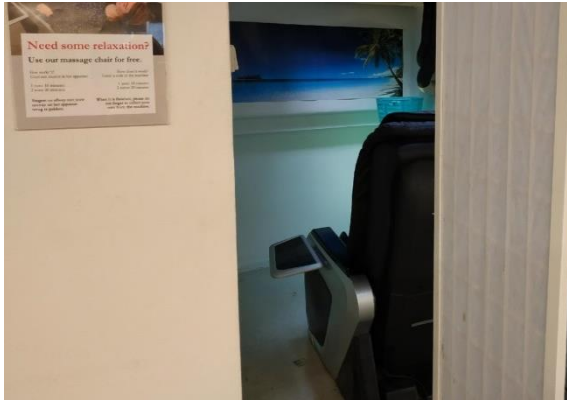
Espace de relaxation avec des fauteuils de massage