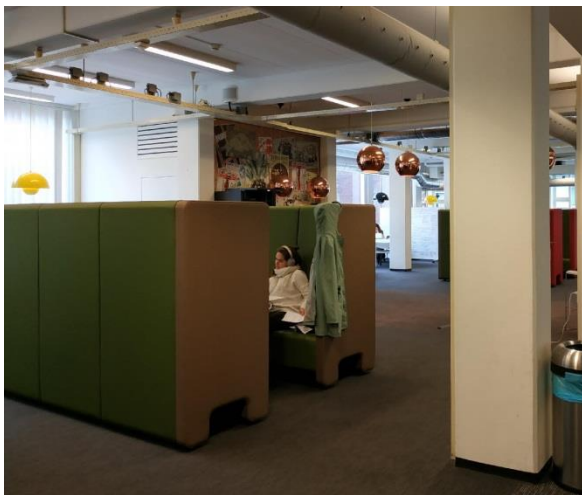
Espaces de travail propices au travail collaboratif