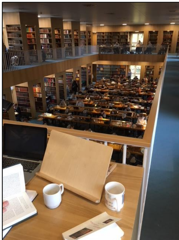
Une salle de travail silencieuse

Les collections se composent de 3 742 194 livres et périodiques papiers, de 518 964 documents électroniques, de 2 591 694 documents numérisés et de 1 616 510 documents sur autres supports, pour 267 000 prêts par an.