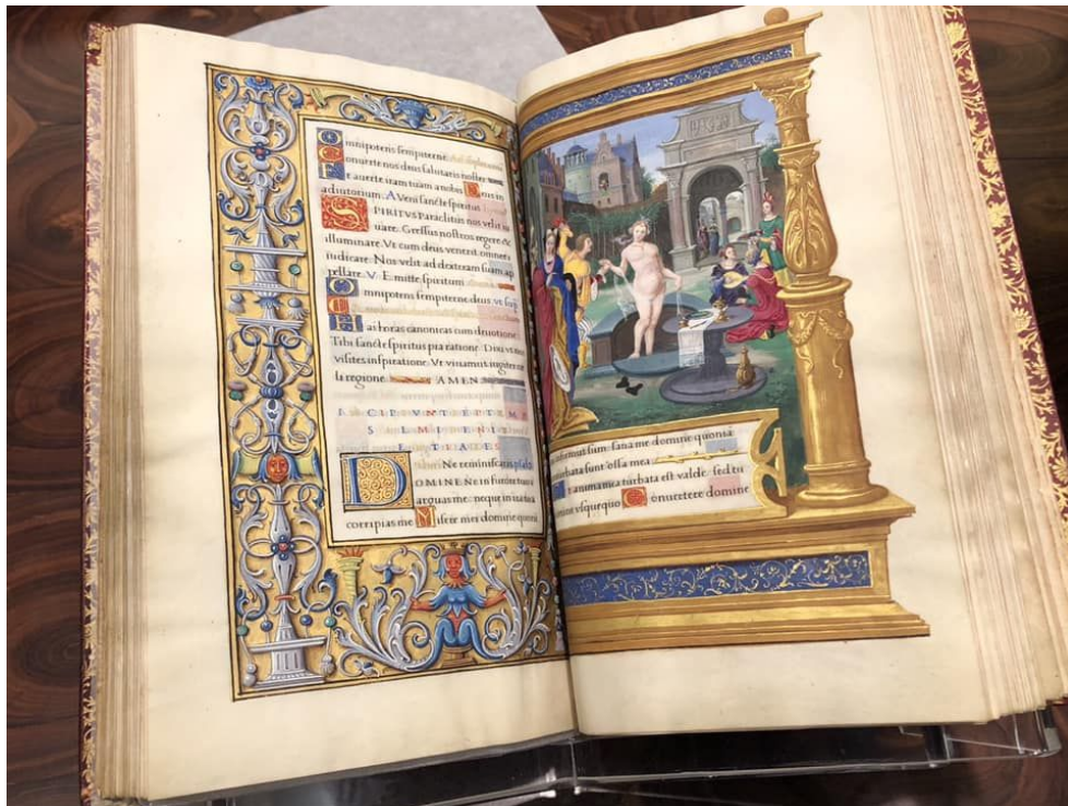
Geoffroy Tory (?), Book of Hours (1524)