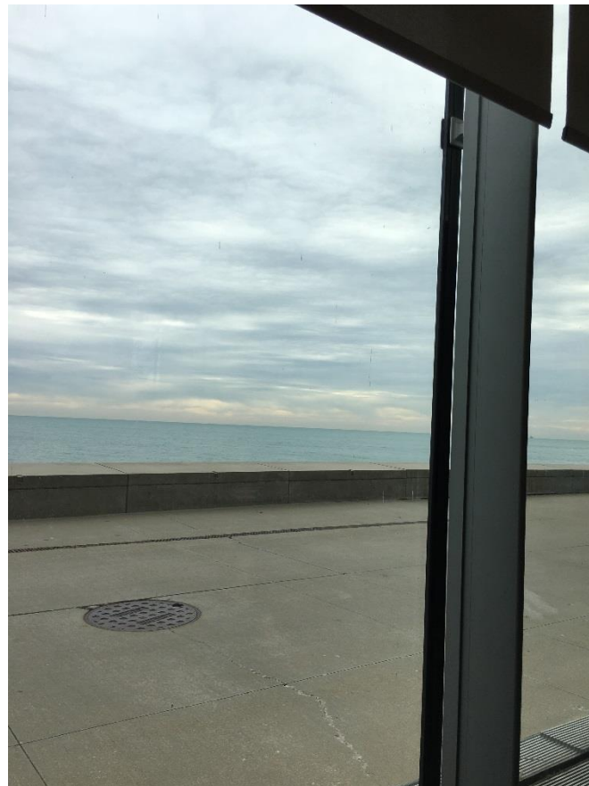
Vue sur le lac Michigan depuis la salle de lecture