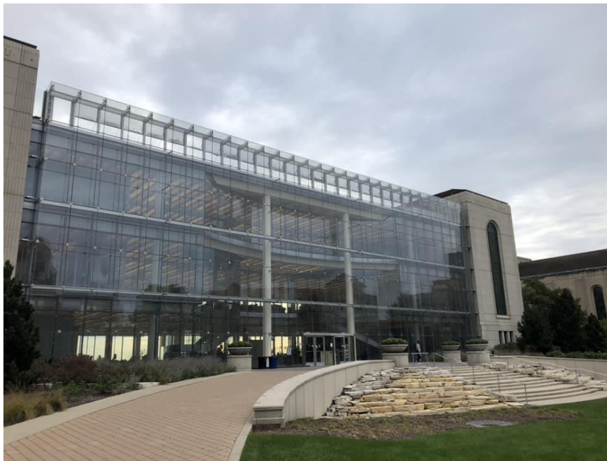
Klarchek Information Commons Site Web

Rédigé par Yann Kergunteuil (Bibliothèque municipale de Lyon)